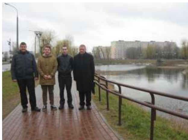
Пруд в королевской резиденции Августово (современные фото)

Встреченный в воде так называемый американский рак тому доказательство. Надо сказать, что Родина этого рака – Америка, и он был завезен к нам сравнительно недавно – несколько десятилетий назад, и очень хорошо прижился. Сейчас не только составляет конкуренцию нашим аборигенным видам, но и где-то уже вытесняет их. Дело в том, что наши виды предпочитают чистую воду, а американские раки могут выживать даже в грязных водах очистных сооружений.