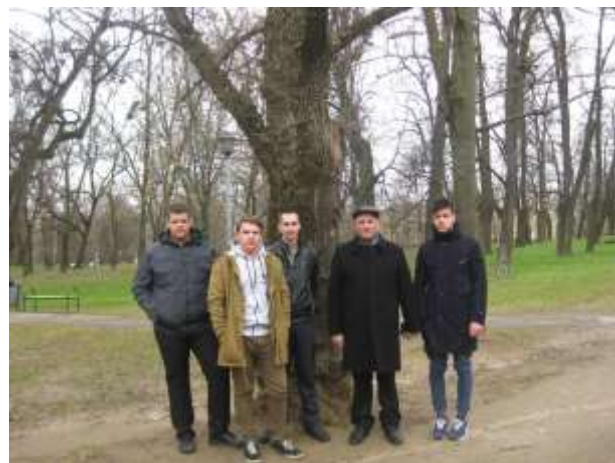
Парк Станиславово (современное фото)

Уже долгое время эта территория принадлежит аграрному университету, именно здесь студентов учат, как делать свой край лучше и богаче. Не символично ли это?