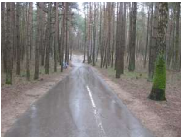
Аллея в урочище «Лососно»

Урочище Лососно , которое располагается между микрорайоном «Лососно» и больницей скорой помощи, называется «урочищем», потому что этот естественный природный комплекс отличается от таких же природных естественных комплексов, которые находятся вокруг. Еще при Советском союзе здесь был создан пляж и спасательная станция. Пляж назвали в честь 22-го съезда КПСС, а окружающий дикий лес приспособили системой осевых аллей для более удобного доступа горожан к реке Неман.