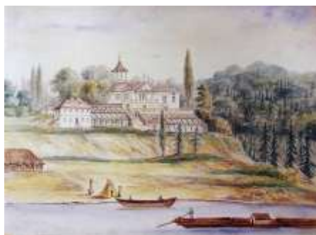
Дворец в Понемуні (конец 18-го века)