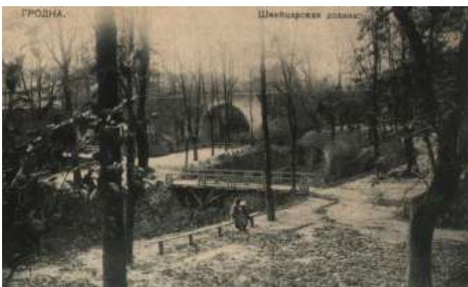
Швейцарская долина (начало 20-го века)

Парк Жилибера. Про парк Жилибера можно рассказывать много и долго. Но надо подчеркнуть, что в нем четко сочетается природная часть «Швейцарская долина» с архитектурой: театром кукол, зданием медицинской академии конца 18-го века, зданием мужской гимназии имени А. Мицкевича и игровая развлекательная часть «Аттракционы».