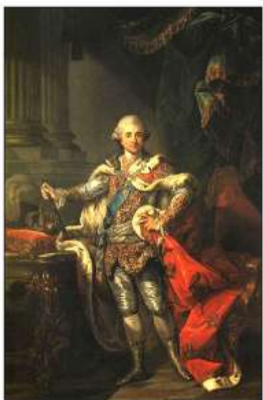
Король Речи Посполитой Станислав Август Понятовский

Ни парк Жилибера, ни тем более зоопарк не являются самыми старыми парками на территории Гродно. Парковые комплексы начинаются с тех парков, которые находились около города. Не зря Гродно называют королевским, потому что здесь располагались три королевских резиденции: Августово, Станиславово и Понемунь, и при них были парки. В Гродно сохранилось немало древних замков, храмов, домов, но среди исторических достопримечательностей города особое место занимают резиденции последнего короля Речи Посполитой Станислава Августа Понятовского [10].