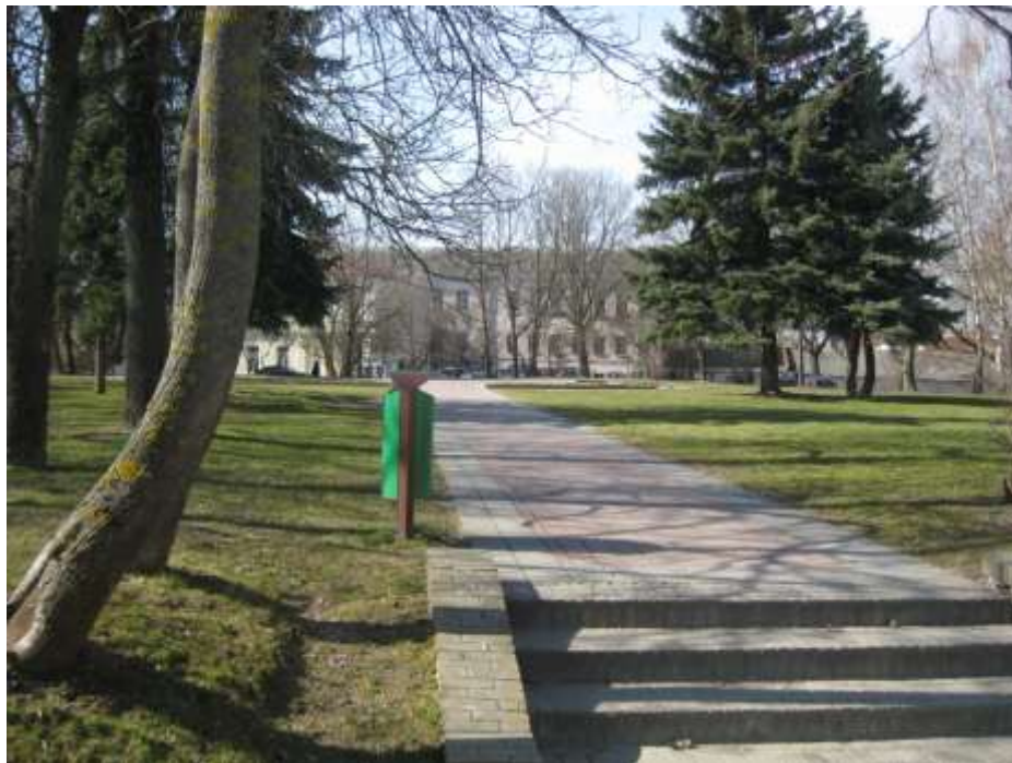
Современный вид сквера на Советской площади

Расположен между Дворцом культуры текстильщиков и Домом профсоюзов. Ведет свою историю этот сквер относительно недавно – с лета 1962 года. Это очень небольшой отрезок времени в многовековой истории города. А вот предшественник этого сквера имел очень давнюю, интересную и богатую на события историю. Здесь возвышался храм, который в разные