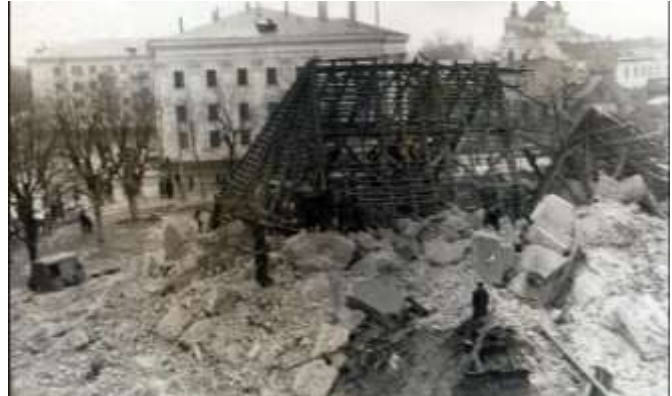
Гарнизонный костел (конец 30-х гг. 20-го века)