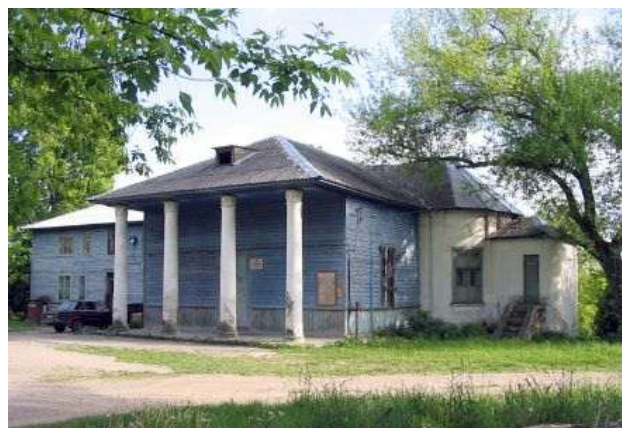
Дворец в Понемуні (современное фото)

Именно Понемуні, уже размещенном в черте города на правом берегу Немана, повезло больше, чем Августово. Здесь дворец сохранился до наших дней. С середины прошлого века в нем жили люди. В начале 90-х годов 20-го века один из главных шедевров дворцово-парковой архитектуры г. Гродно пытались восстановить. Резиденция польского короля в Понемуні является вершиной творчества Дж. Сакко [4].