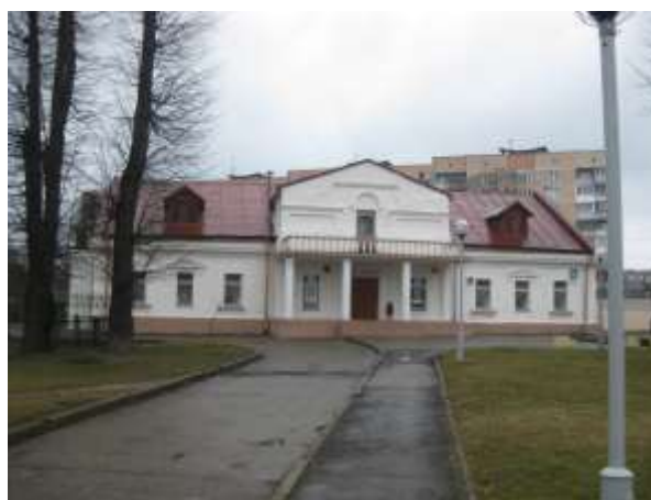
Здание корчмы имения Августово

Дело в том, что, видимо, по каким-то хозяйственным нуждам старые липы были срублены, но из спящих почек, оставшихся на пне, выросли эти молодые деревья. Радиус расположения говорит о том, что этим липам около 150-200 лет. После Понятовского Августово владели многие хозяева, но самым известным среди них был древний ирландский род О' Бrien де Лассии. Сейчас имение составляет рекреационную зону по улице Репина [2].