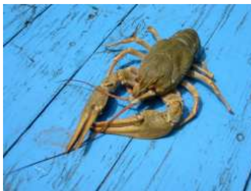
Американский рак (лат. Pacifastacus leniusculus)

Парк и имение Августово имели естественную ограду. Ее составляли липы, и сейчас, присмотревшись к этим молодым липам, можно заметить, что они растут из одного места, как будто имеют что-то общего между собой.