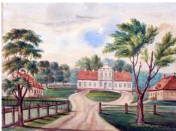
Станиславово (конец 18-го века)

К имению Станиславово из города вела длинная аллея из лип, ее в народе называли аллеей любви.