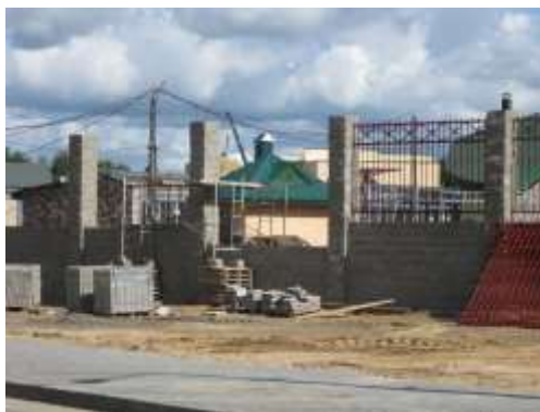
Масштабная реконструкция зоопарка (фото 2010 года)

Даже приобретение новых животных не обходилось без влияния политики: в июне 1953 года московская контора «Зооцентр», которая централизованно занималась комплектацией советских зоопарков, получила из «братского» коммунистического Китая большую партию экзотических животных, кое-что из этого приобрел и Гродно. В 1953 году кандидат ботанических наук Н. Иоффе предложил зоопарку показывать морских рыб, приспособленных к жизни в пресных водах, а уже через два года здесь появился и свой слон, занявший вольер, в котором раньше обитали обезьяны. Тогда же появился и мостик через Городничанку и водопровод в аквариум-террариуме. Вскоре зоопарк купил шимпанзе, которая по популярности на десятилетия заменила собой знаменитую Коко [12].