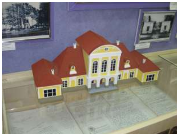
Макет королевской резиденции в Августово, разрушенной во время Первой мировой войны

До сих пор сохранилась система прудов парка. Их осталось только два и они, как и раньше, не соединены каналами.