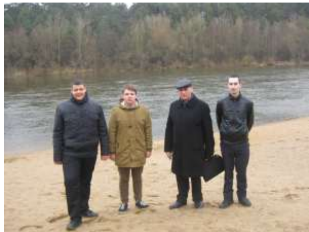
Пляж урочища «Лососно»

Лес остался диким, несмотря на благоустроенный пляж и окружающий городской ландшафт. Поэтому после вхождения этой территории совместно с деревней Лососно в городскую черту решили устаревшее и многим уже непонятное название пляжа заменить на урочище «Лососно», включив сюда