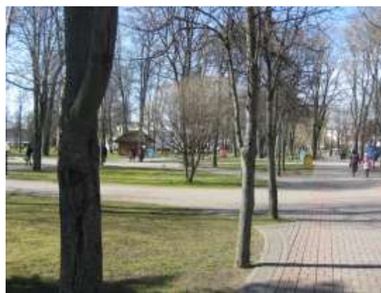
Парк Жилибера (современное фото)

Но надо еще заметить, что Жилибер, когда создавал на этом месте ботанический сад, не думал о том, что здесь будет такой парк, а тем более что Ян Кохановский на его базе создаст еще один, правда уже зоологический.