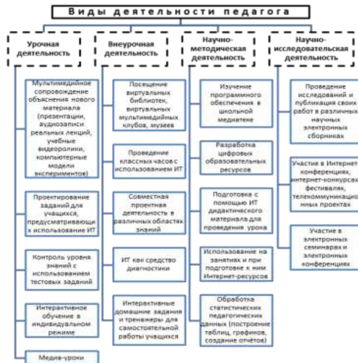
Рисунок 1 Виды деятельности педагогов с использованием информационных технологий