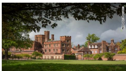
Eton School (Text 2)