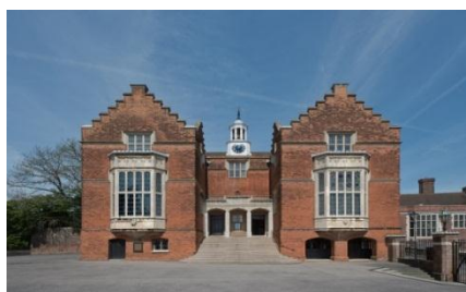
Harrow School (Text 1)

На данном основном текстовом этапе будет применен метод перекрестного чтения, который подразумевает чтение не своего текста, а текста своего партнера. Чтобы узнать и обобщить информацию о школе, учащемуся следует задавать специальные вопросы своему партнеру, записывая полученную информацию в денотатную таблицу.