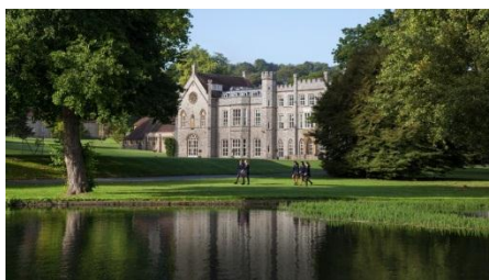
WycombeAbbey (Text 3)

Чтобы извлечь необходимую информацию после прочтения текстов, учащиеся задают друг другу следующие вопросы: